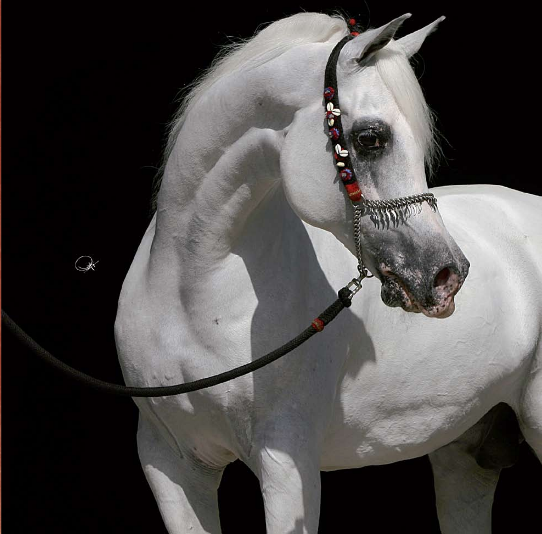
El Thay Mashour ( Madkour I x El Thay Bint Kamla by El Thay Mansour ), 1994 الطاي مشهور (مدكور الأول X الطاي بنت كاملة من الطاي منصور)، 1994