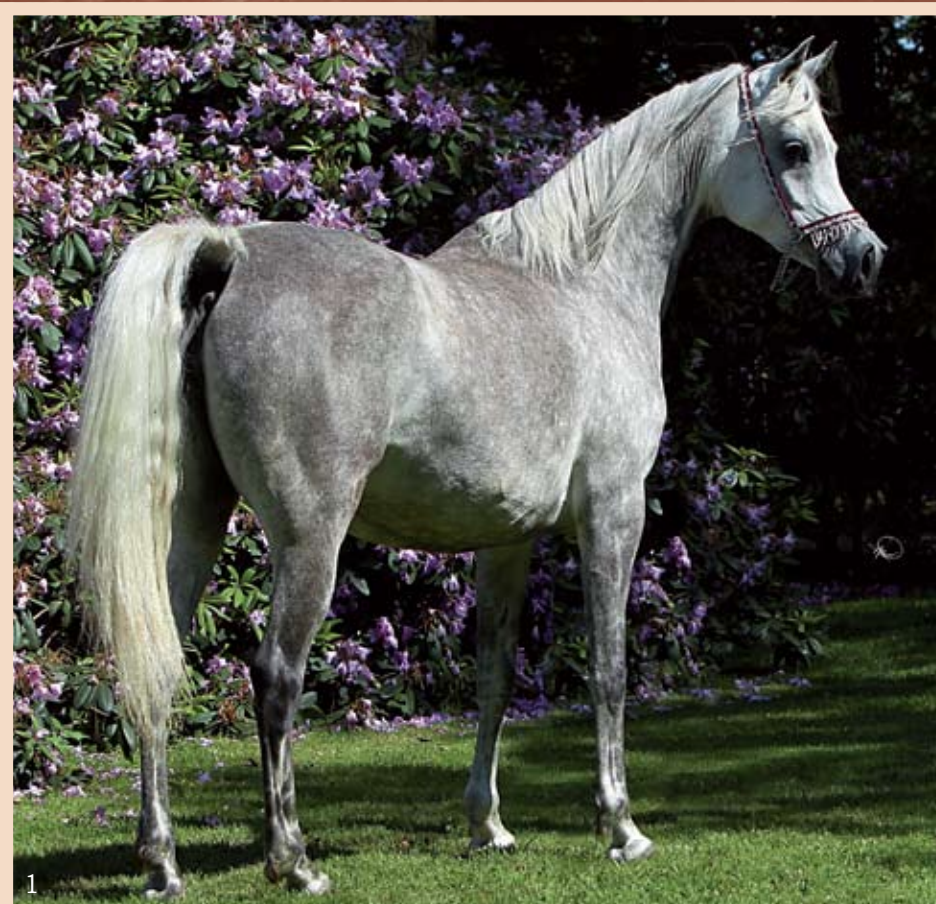
1- El Thay Malakah (El Thay Mashour x El Thay Mahfouza by El Thay Ibn Halim Shah), born 2005.