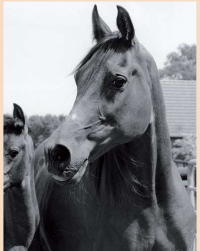
El Thay Maheera (Nizam x Mona II) Elite Mare, Siglawi Jedrani - Moniet El Nefous family « فرس نخبة » الطاي مهييرة (نظام X منى الثانية) صقلاوى جدران - عائلة منيبة النفوس