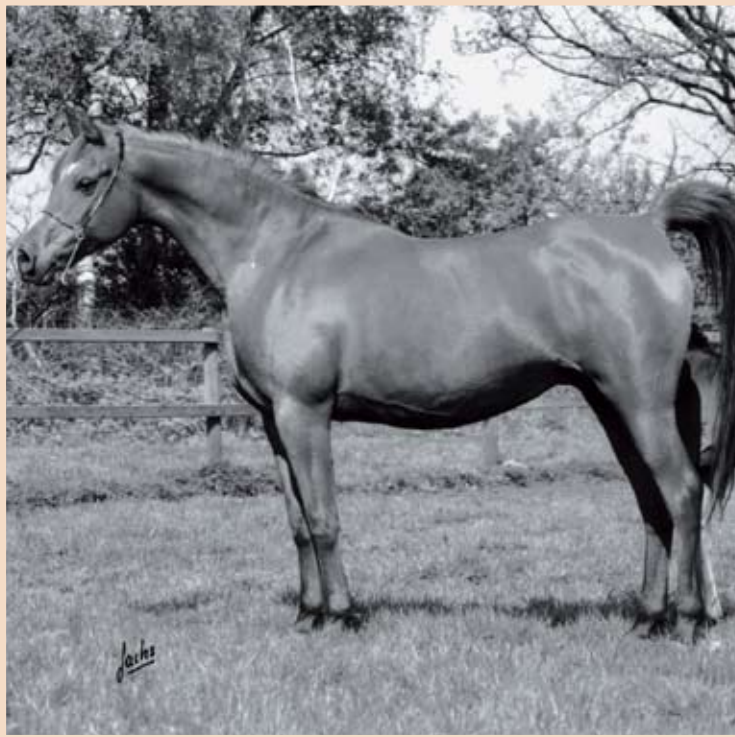
El Thay Mansoura (Machmut x Morawa by Nizam) Elite Mare, Koheila Rodania - Riyala family, now 28 years old الطاي منصوره (مخموت X موراوا من نظام) فرس نخبة، كجيلان رودانيا - عائلة رباله، والآن فى سن ال 28